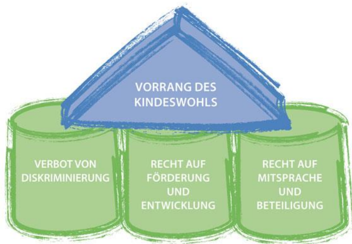
Grafik: Das Gebäude der Kinderrechte

Architecture et catégorisation des droits de l'enfant. Gebäude und Bausteine der Kinderrechte. Source: sur base de la fiche pédagogique "Contenu de la Convention Internationale relative aux droits de l'enfant" Module pédagogique n° 2008/03 (Mai 2008) éditée par Droits de l'enfant a.s.b.l. ( http://www.dei-belgique.be/en/component/k2/item/121?Itemid=211 ) en combinaison avec le document "Das Gebäude der Kinderrechte" édité par la "National Coalition für die Umsetzung der UN-Kinderrechtskonvention in Deutschland" (auf der Grundlage von Jörg Maywald: Kinder haben Rechte! Weinheim, Basel 2012) www.national-coalition.de . (Charel Schmit, 2014-2015, www.kannerrechter.lu )